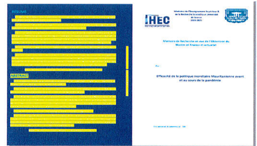
Page de couverture de boîtier